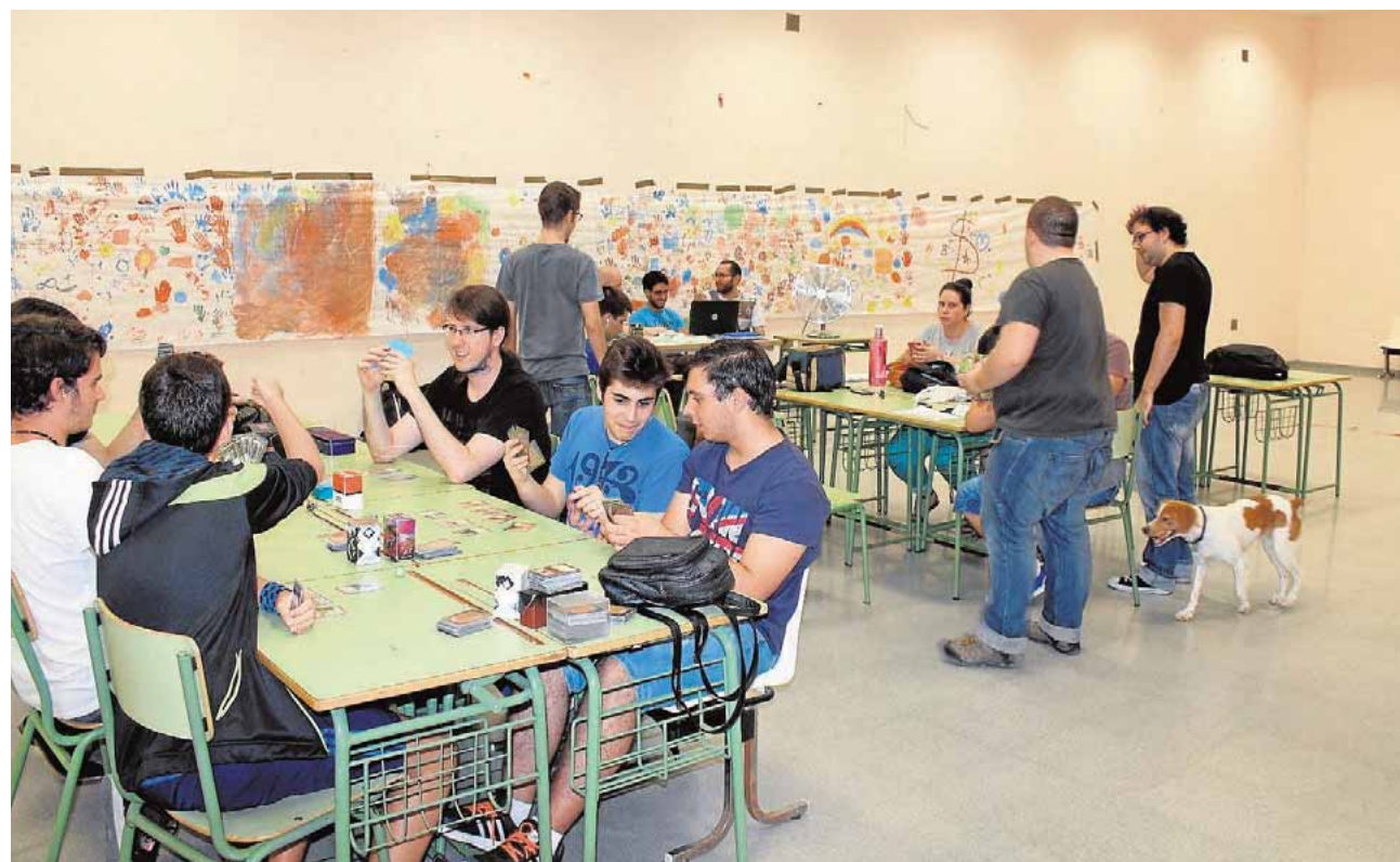
Las «Noches en Vela» de los viernes reúne a varios jóvenes en la Huerta del Hospital

Jornadas maratonianas Las actividades estelares son el rol en vivo, deporte, juegos de mesa, talleres, torneos y videojuegos