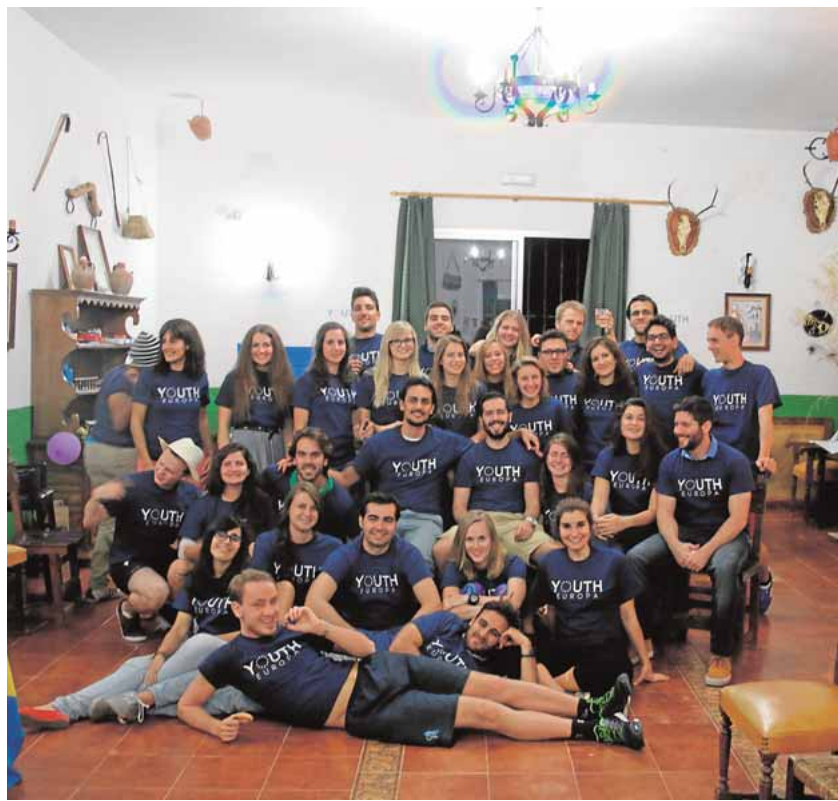
Jóvenes del proyecto Erasmus + durante su estancia en El Pedroso

Durante estos días los jóvenes participantes, procedentes de Noruega, Ucrania, Italia y España, han practicado baloncesto, voleibol o fitness orientados por distintos expertos y han recibido las charlas sobre nutrición y salud, primeros auxilios, discapacidad y deporte, igualdad de género y deporte o respiración cardiorpulmonar.