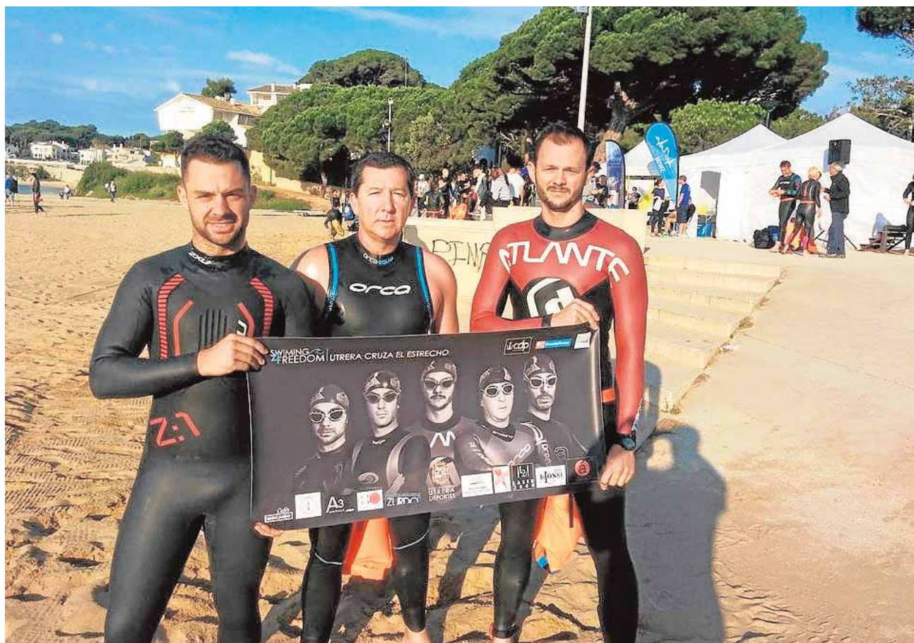
Tres de los integrantes de este reto posan con el cartel publicitario de «Utrera cruza el Estrecho»

cabo el próximo 22 de noviembre. Como en ediciones anteriores, se otorgarán trofeos a los primeros clasificados de cada categoría y tres premios económicos a los tres primeros clubes no locales que finalicen con más participantes. A.H.