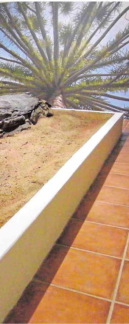
El Pedroso de la Plata.

colas de Cazalla S.L. Los empresarios interesados en participar deberán presentar una única oferta por la totalidad del rebaño. El precio mínimo de licitación del contrato es de 80 euros por oveja, sin IVA, y de 60 euros por borrego. G.J.