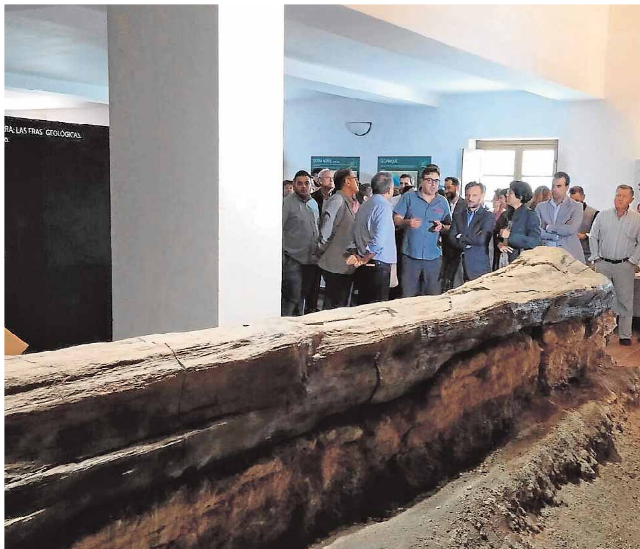
Una imagen del tronco fosilizado de Almadén de la Plata, ayer, en el centro de visitantes del Cortijo El Berrocal AC

Único en España y uno de los cinco que hay en todo el planeta