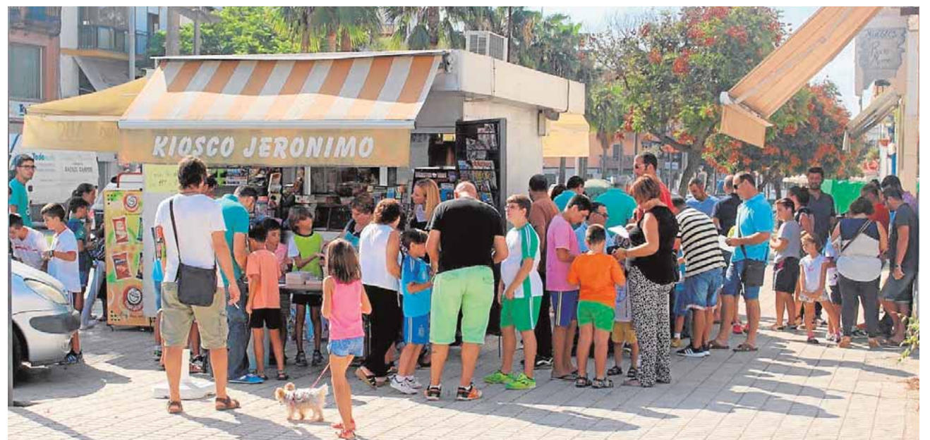
Medio centenar de niños y familiares durante el intercambio de cromos