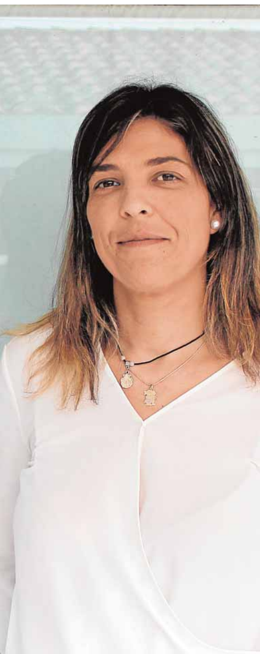
a por Pilas.

zona limítrofe entre ambos municipios, de una rotonda que eliminará este cruce semafórico, lo que aliviará notablemente el tráfico en la entrada y salida de Espartinas por Gines, a la espera de la ansiada salida a la A49 por la SE 40.