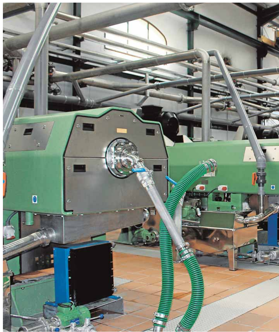
La sala de producción, en la imagen, ha sido ampliada este año para atender a la cr

Otra de las particularidades de esta empresa es que la mayoría de su producción, el 99 por ciento, se destina a la venta a granel, gran parte de ella a grandes marcas aceiteras, por lo que, sin saberlo, en buena parte de España se consume aceite ecijano envasado con el nombre de otros sellos comer-