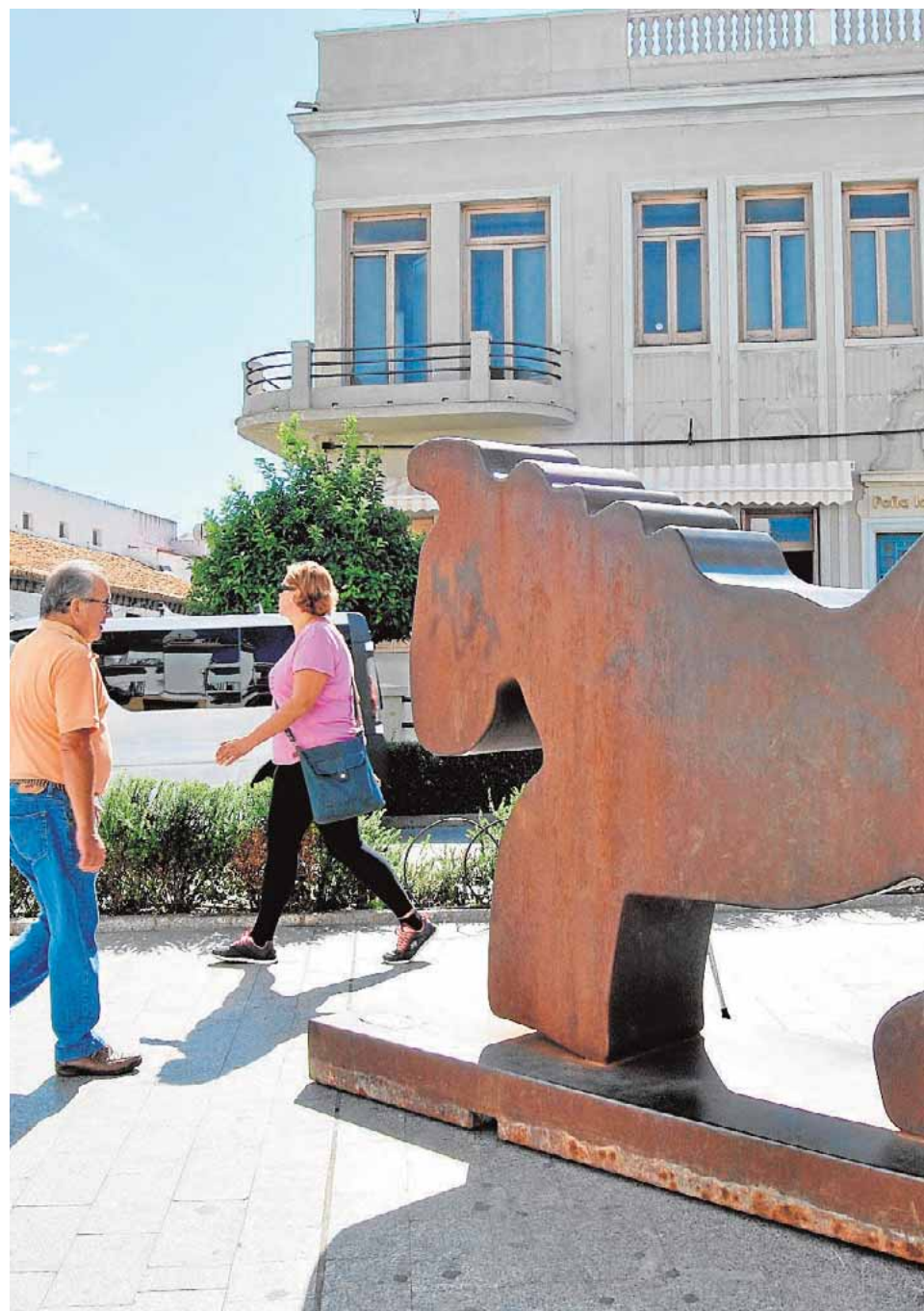
Un monumental caballo contrasta estos días su silueta con el teatro Cerezo

Cuando Méjica echó a rodar sus monumentales piezas, lo hizo con el objetivo de configurarlas como una forma de acercamiento del gran público al arte contemporáneo. «Se trata de algo simi-