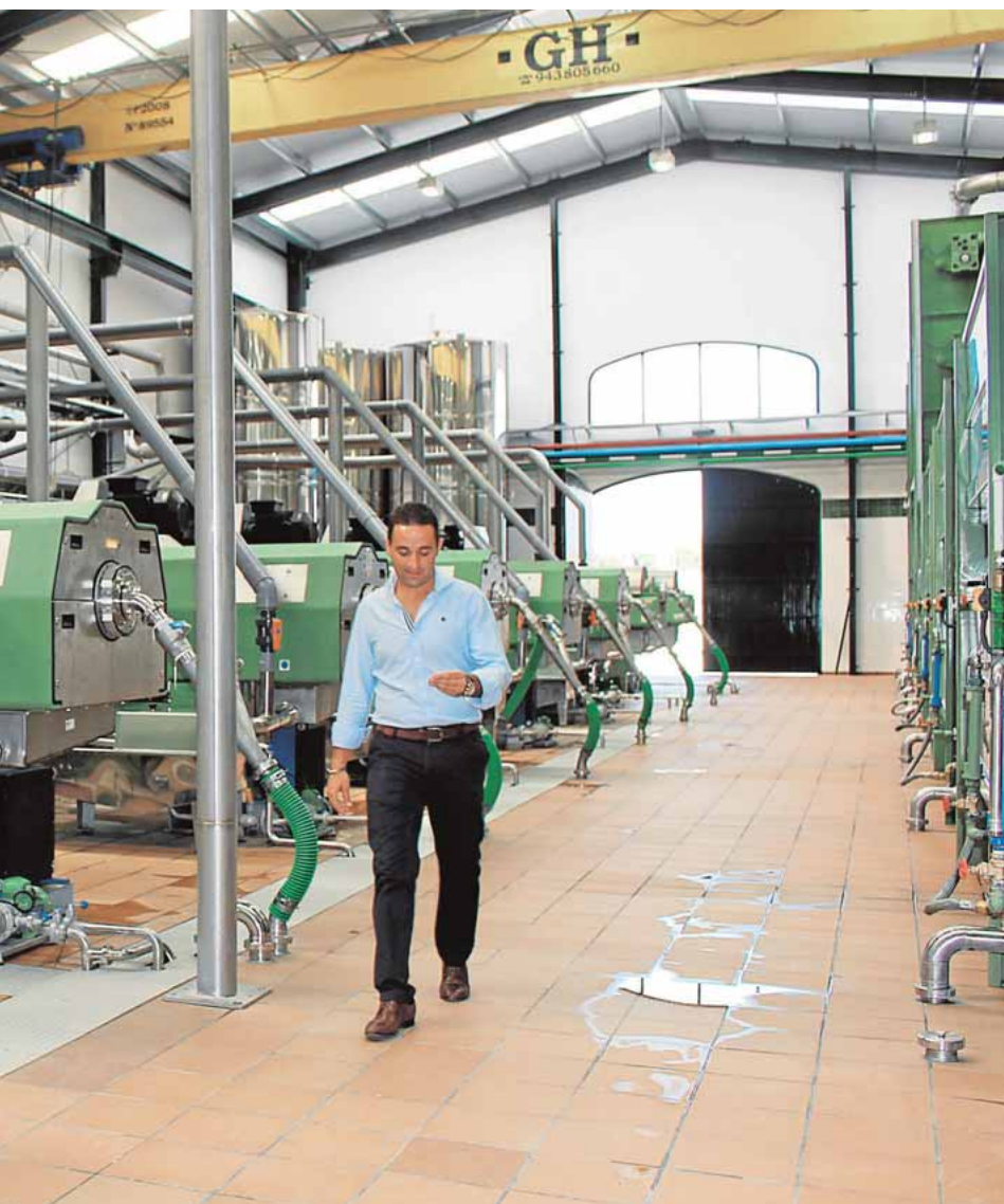
eficiente demanda que experimenta la almazara

dalidad de semipresencial. Las clases tienen una duración de 4,5 horas semanales, 2,5 horas de docencia directa y 2 horas de atención online y se impartirán en Écija y La Luisiana. La matrícula se formaliza en la Escuela Oficial de Idiomas de Écija.